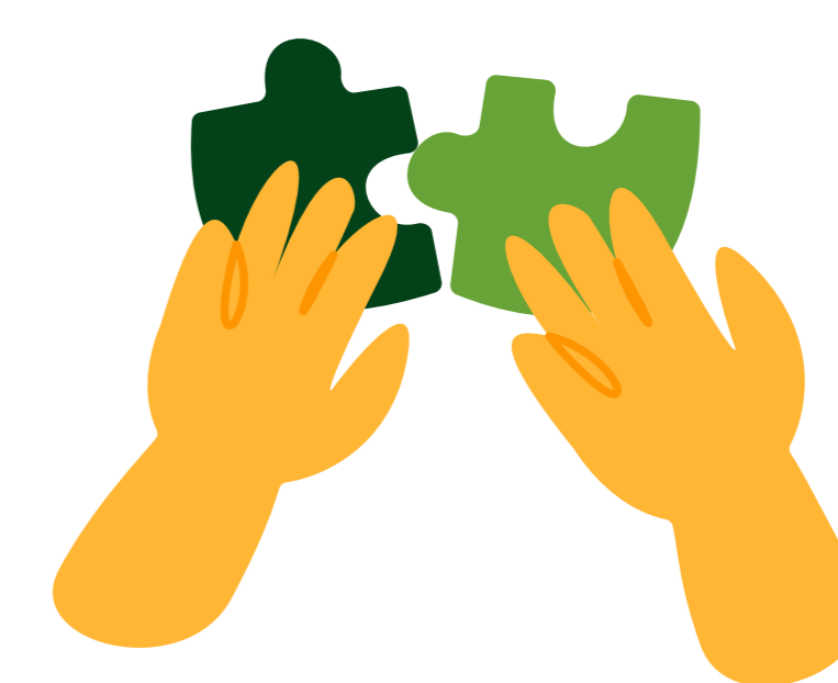
Manier van werken